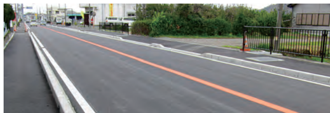
鋸南町下佐久間付近