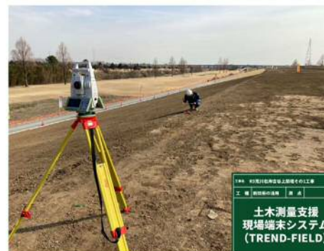
自動追尾式TS/トレンドフィールド

設計値に比べ施工された盛土の高さが色によって把握できる。緑色のため設計値の高さを満たしている。