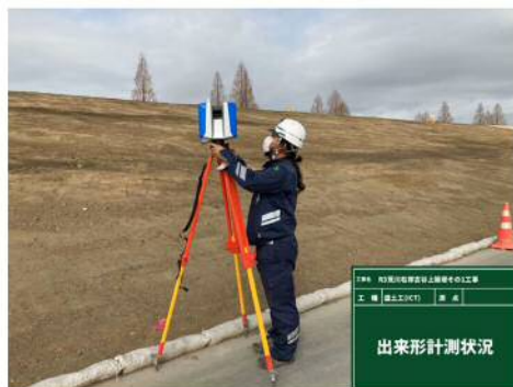
地上型レーザースキャナー

自社保有の機械を使用することにより現場状況により計測・解析・立会いを行うことができる。