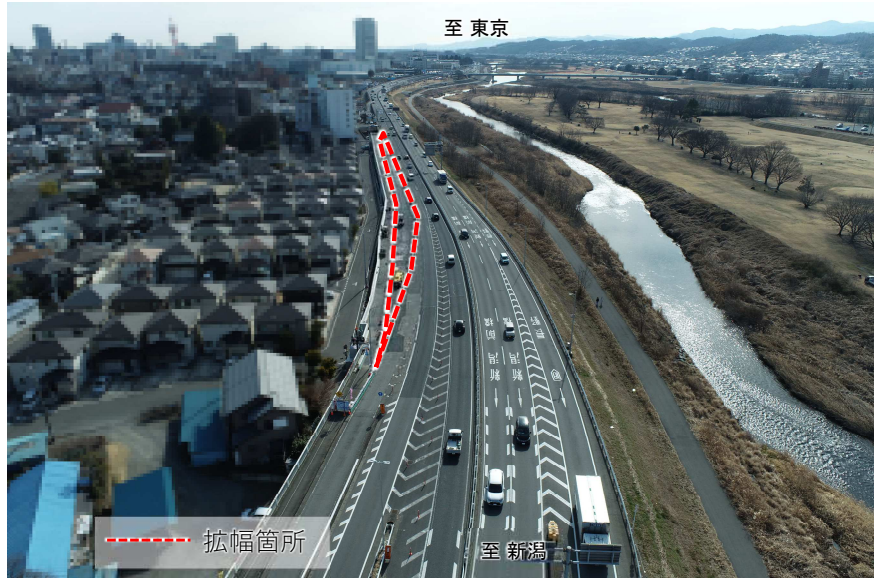
拡幅区間の工事状況