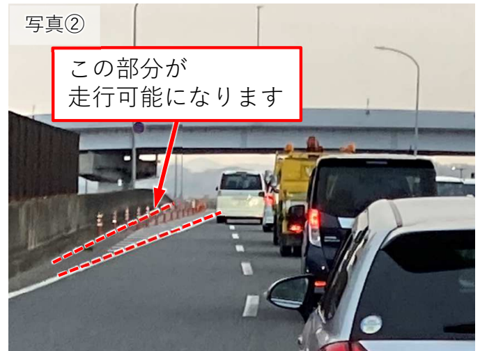
車線絞り込み箇所