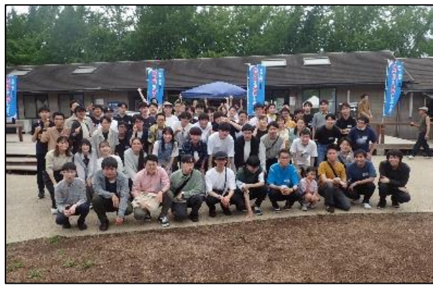
新採BBQ 昭和記念公園（2023.6）