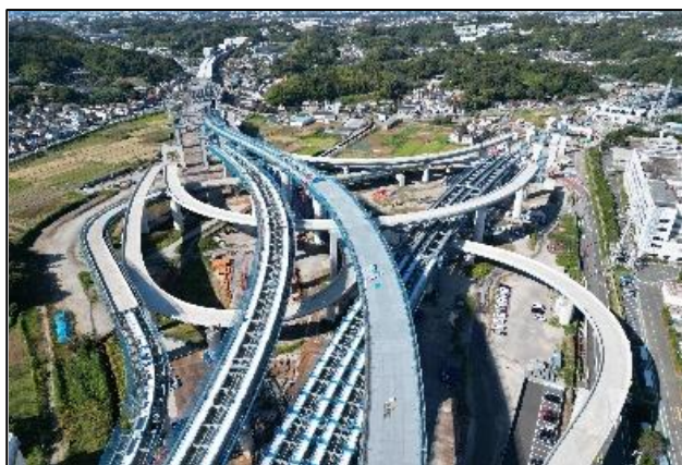
道路事業 圏央道（横浜環状南線）神奈川県（事業中）