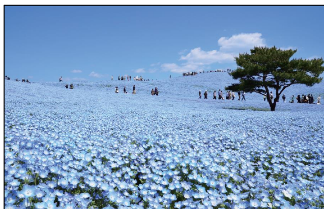
公園事業 国営ひたち海浜公園 茨城県