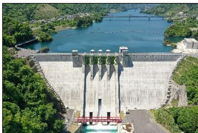
河川事業 ハッ場ダム 群馬県（2020.3完成）

関東地方整備局では、様々な職種の職員が力を合わせて業務を行っており、首都圏を支え、都県をまたぐビックプロジェクトに携わることができます！