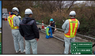
③安全面でのサポート支援