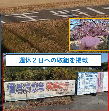
週休2日への取組を掲載