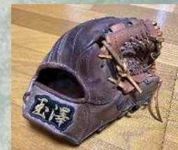
使用していたグラブ

休日は、野球観戦などでリフレッシュしています。 小・中学生時代に、野球をしていた影響で、今でも野球が大好きです。