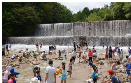
北アルプスの清流で川遊び