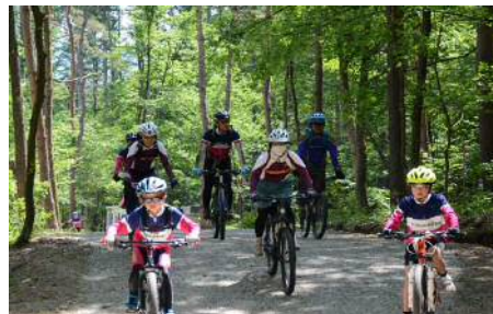
森の中を疾走、マウンテンバイクパーク