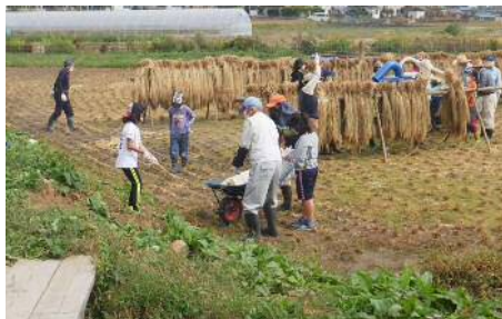
体験プログラム（稲刈り体験）