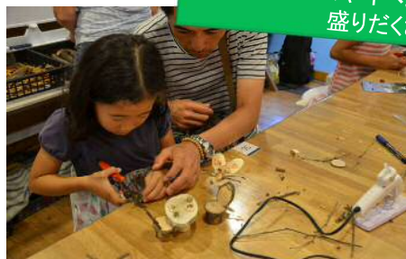
体験プログラム（木工作体験）