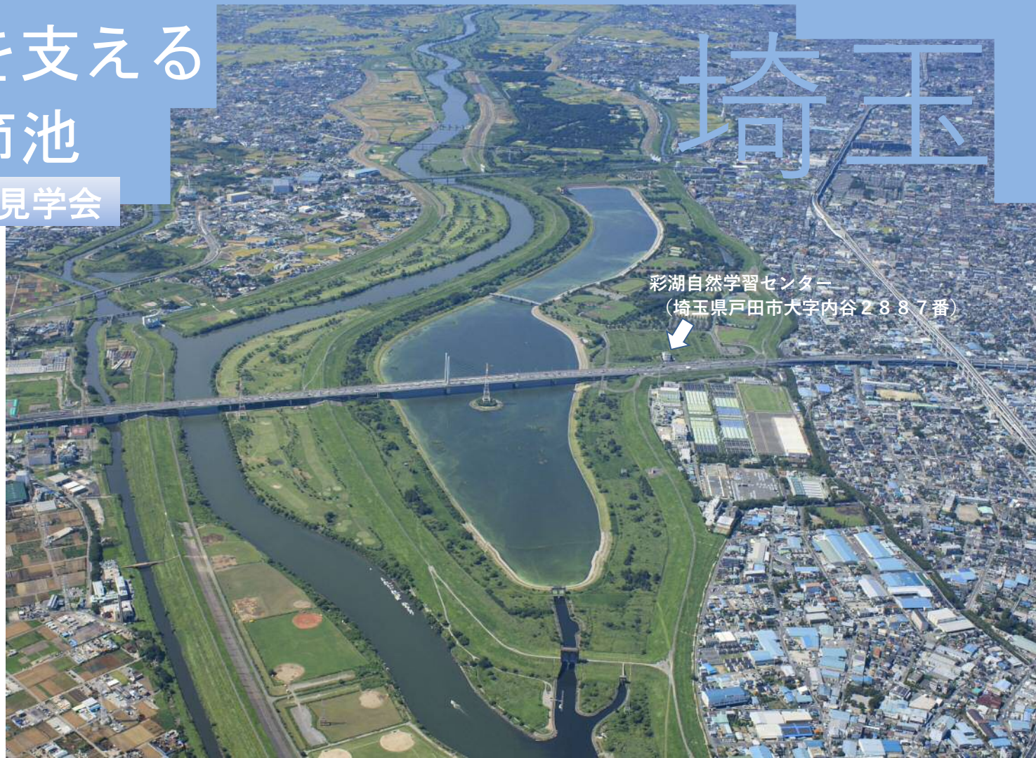
彩湖自然学習センター (埼玉県戸田市大字内谷2887番)