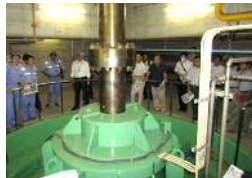
南畑排水機場内の様子

※他にも管内の水門や排水機場の見学も可能となっていますので、受付窓口までご連絡下さい。