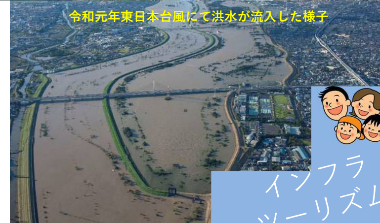
令和元年東日本台風にて洪水が流入した様子