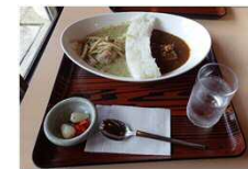
ダムカレー (川治ダム資料館)