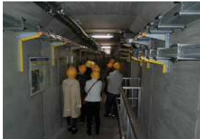
湯西川ダム見学(監査廊)