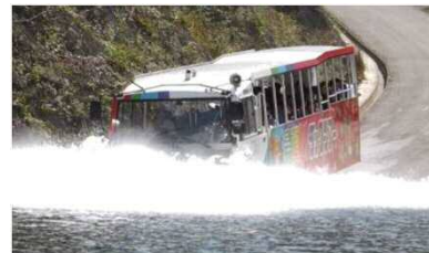
湯西川ダム湖の遊覧 (スプラッシュイン)