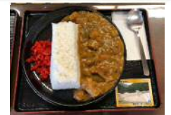
ダムカレー (道の駅「湯西川」)