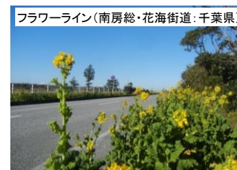
フラワーライン(南房総・花海街道:千葉県)

[ホームページアドレス http://www.mlit.go.jp/road/sisaku/fukeikaidou/ ]