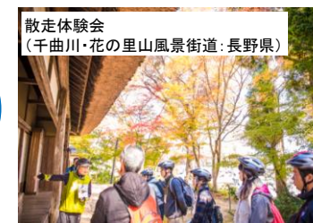
散走体験会 (千曲川・花の里山風景街道:長野県)