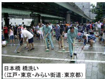
日本橋 橋洗い (江戸・東京・みらい街道:東京都)