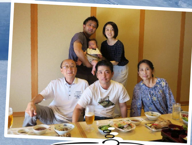
土日の休みを利用して 家族旅行に行きました

工事名: H30東関東道延方地区函渠その1工事 工期: 2018年7月27日～2020年2月14日 2019年12月現在 工事進捗率: 87.7%