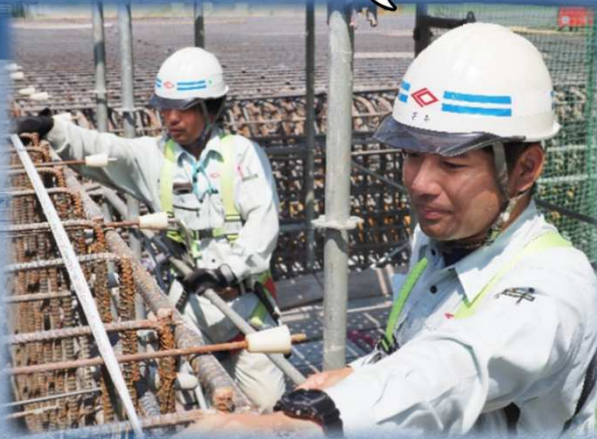
構造物の鉄筋配筋を確認

【週休2日を達成するために】 週間工程・月間工程について 下請業者との調整を密に行い、 休日を取れる体制をとっています。