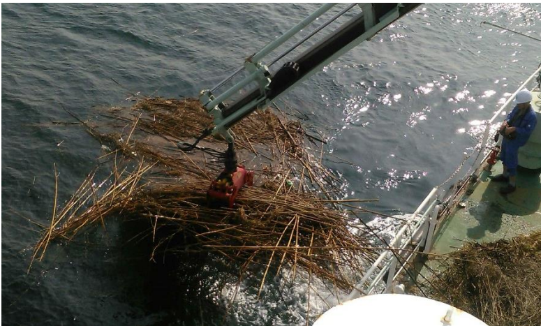
漂流物(竹など)の回収作業