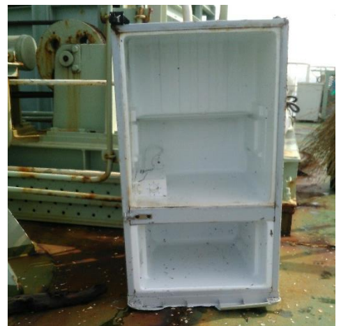
船上に回収した漂流物(冷蔵庫)