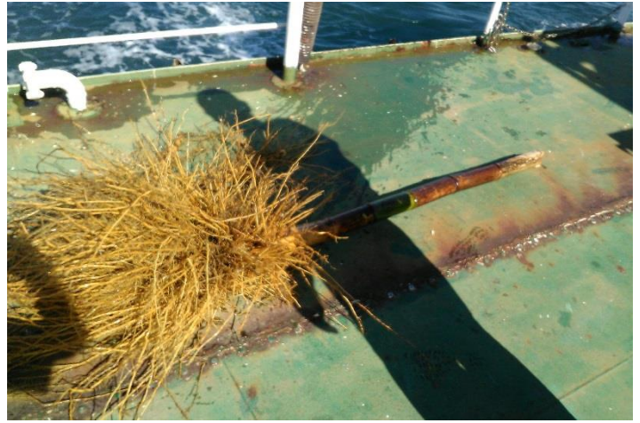
船上に回収した漂流物(竹)