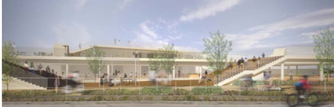
国道134号から見た施設の整備イメージ