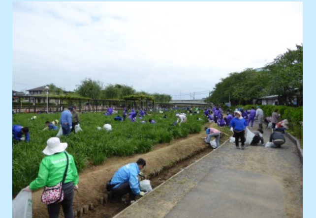
あやめ園整備事業