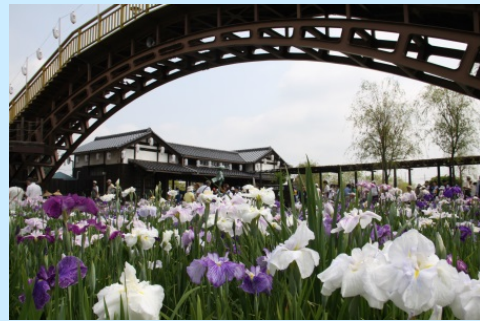
水郷潮来あやめ園