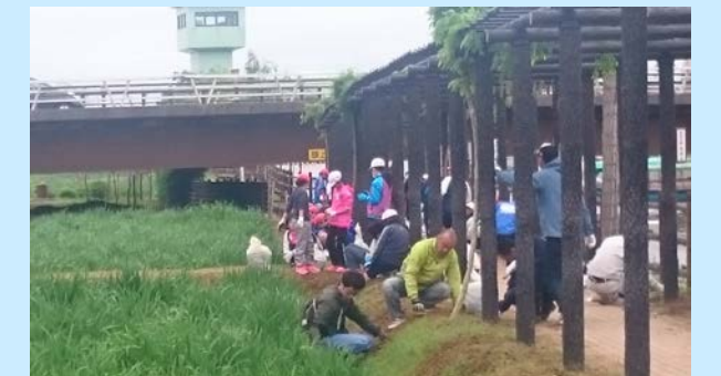
あやめ、藤棚を手入れする様子