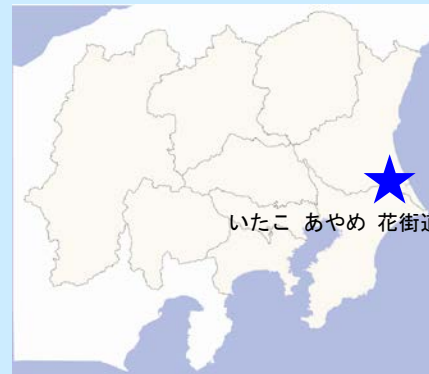
いたこ あやめ 花街道