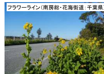
フラワーライン(南房総・花海街道:千葉県)

[ホームページアドレス http://www.mlit.go.jp/road/sisaku/fukeikaidou/ ]