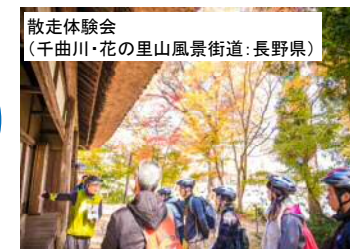
散走体験会 (千曲川・花の里山風景街道:長野県)