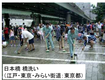
日本橋 橋洗い (江戸・東京・みらい街道:東京都)