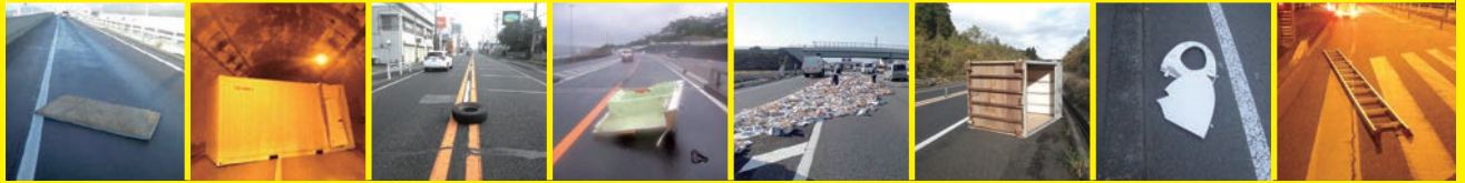
畳 コンテナ タイヤ バスタブ 大量の紙 プレハブ 便座 はしご