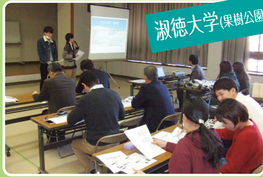
淑徳大学(果樹公園あしがくぼ)