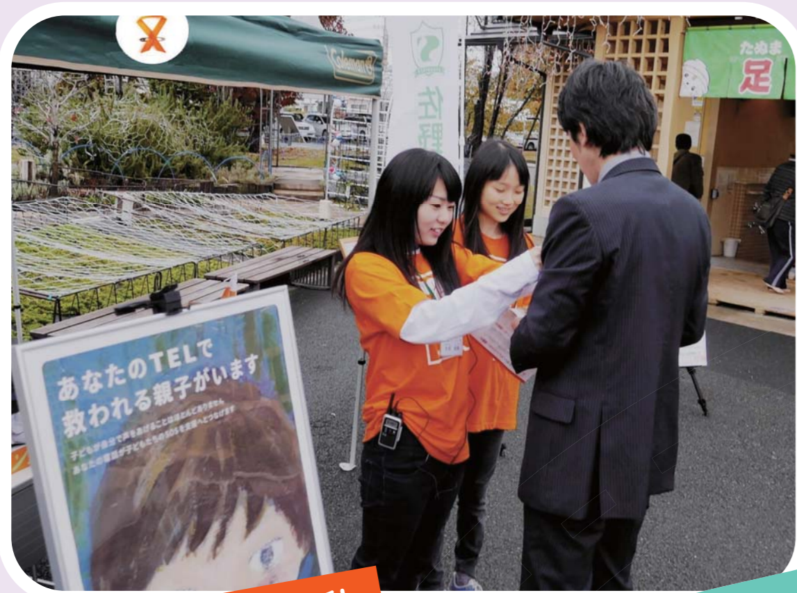
オレンジリボン運動

地域を活性化するため、道の駅をフィールドに 様々な調査、社会貢献活動、イベント等を企画しました。