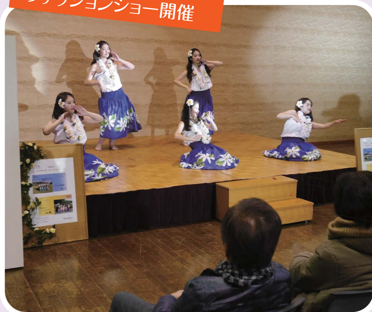
フラダンス& ファッションショー開催