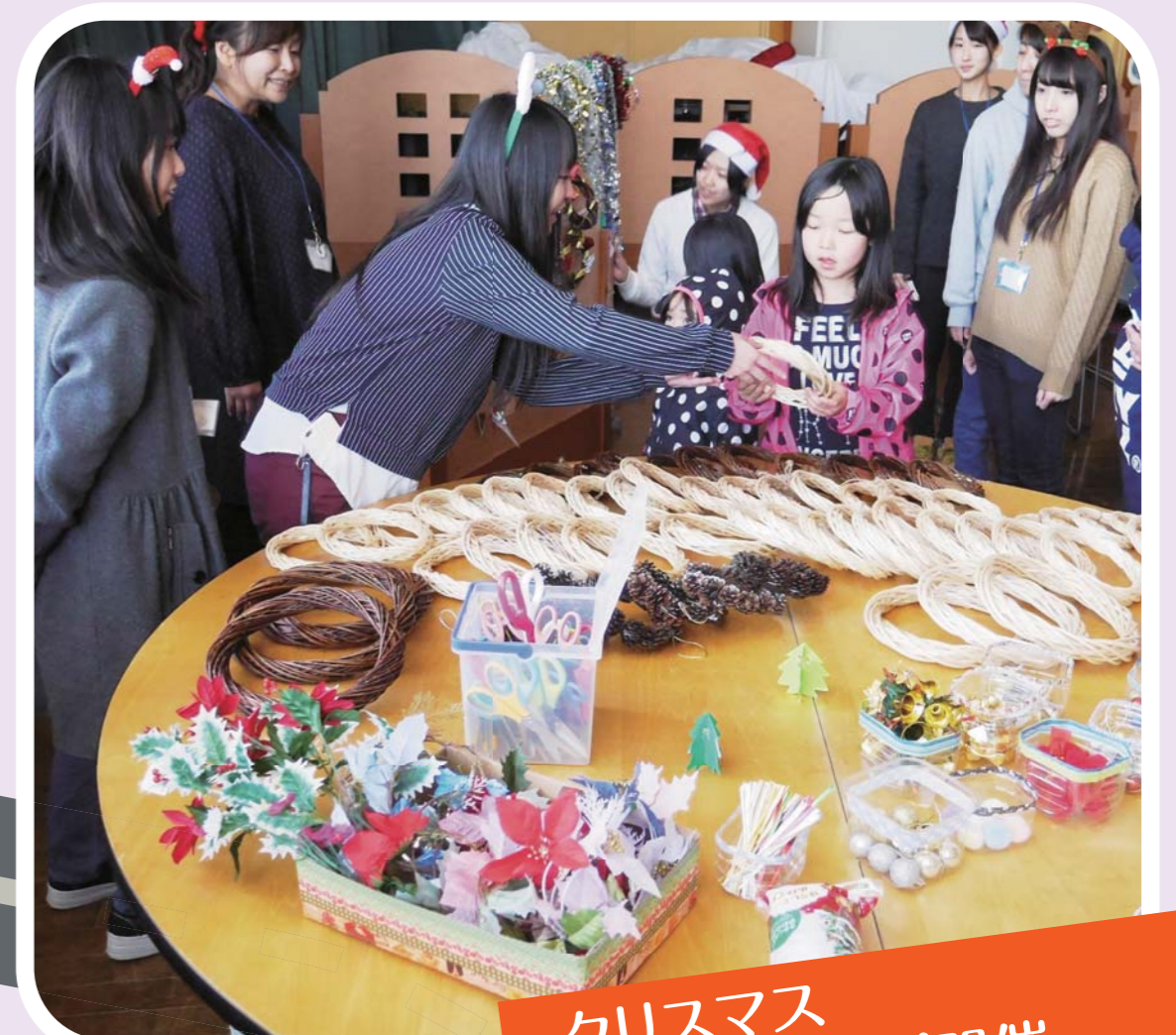
クリスマス ワークショップ開催