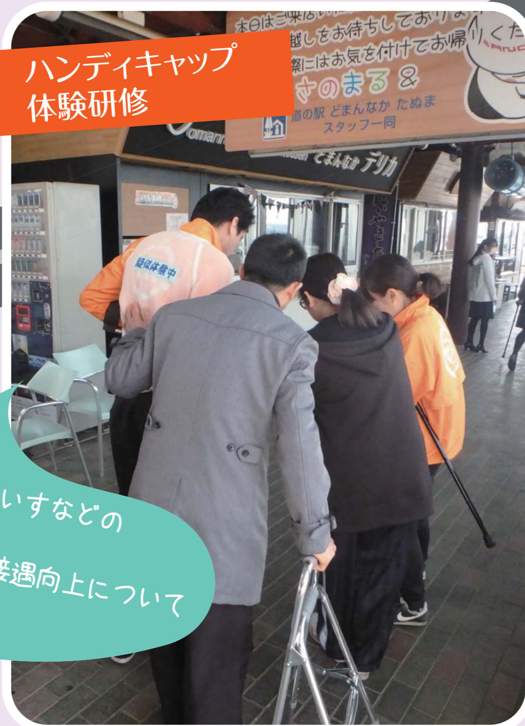
ハンディキャップ 体験研修

道の駅職員と車いすなどの 疑似体験を行い、 障がい者等への接遇向上について 学びました。