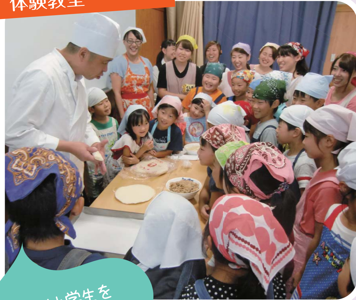
小学生春巻づくり 体験教室