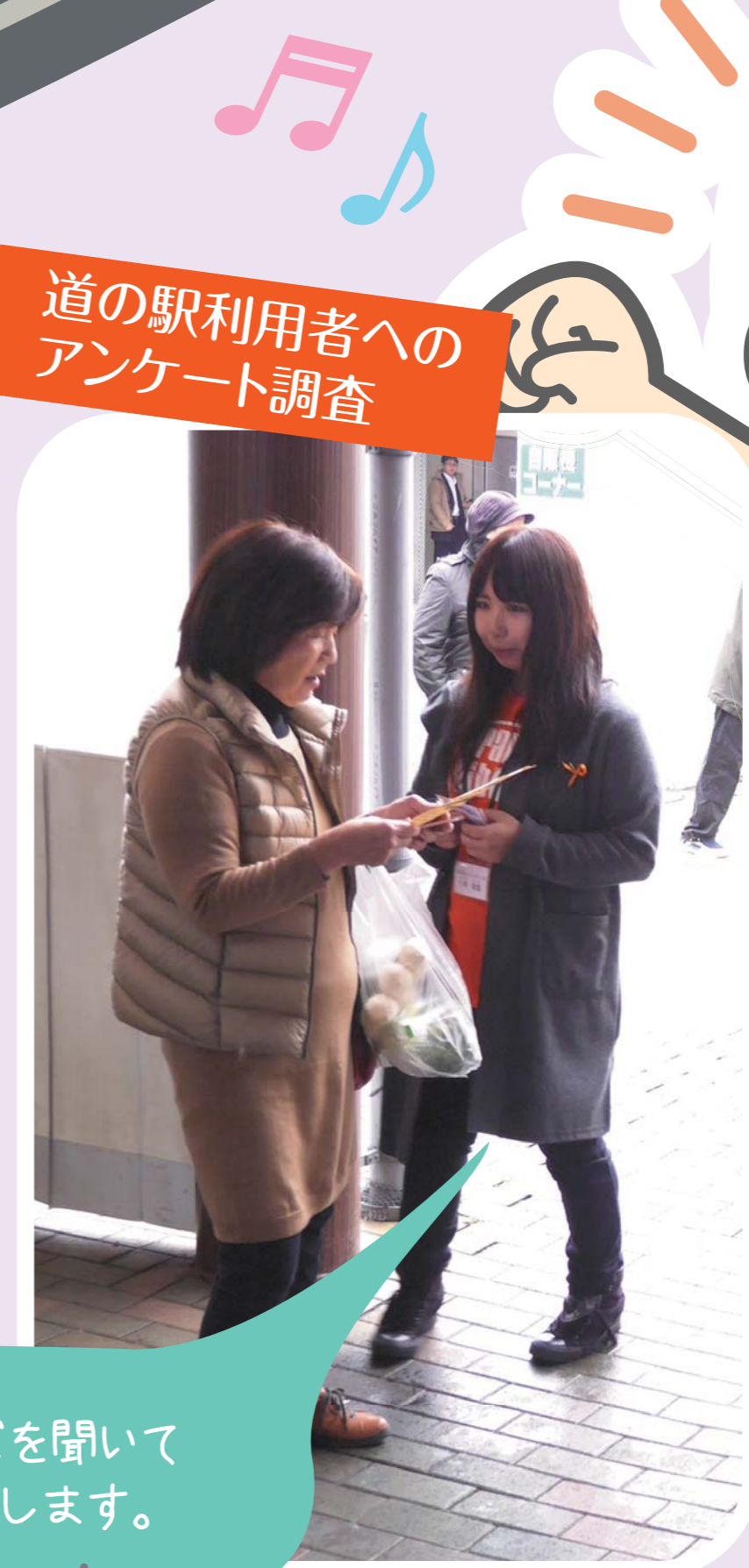
道の駅利用者への アンケート調査

道の駅職員と車いすなどの 疑似体験を行い、 障がい者等への接遇向上について 学びました。