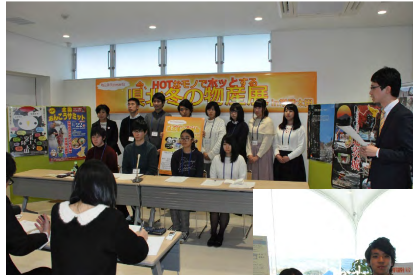
記者会見、PR活動の様子