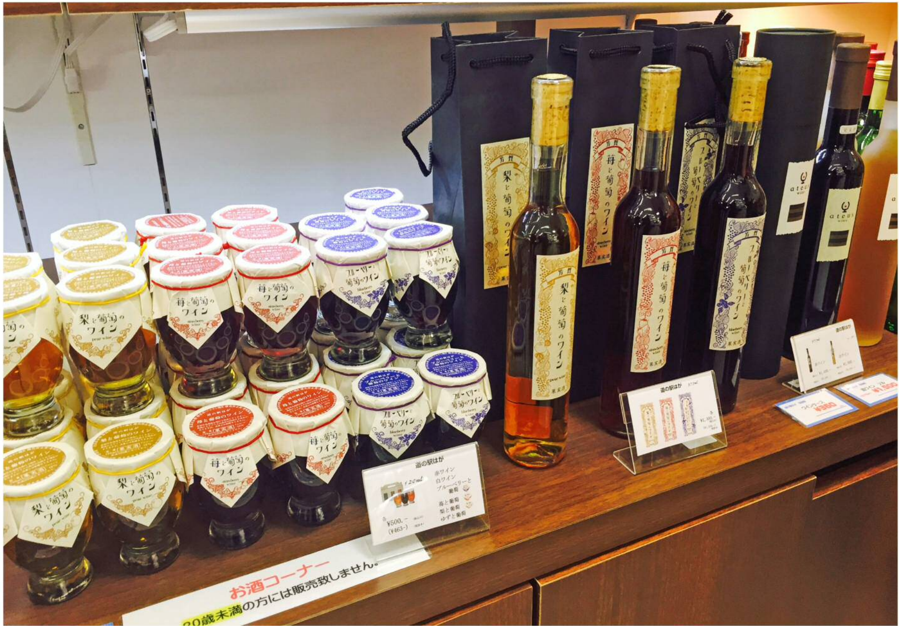
道の駅内のワイン売場