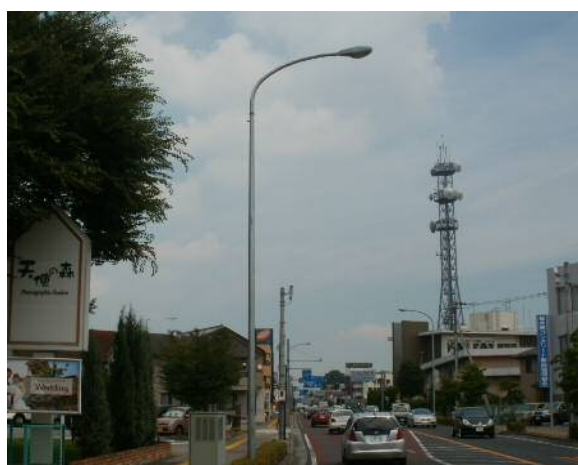
〈国道4号 宇都宮市築瀬町〉