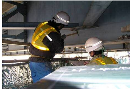
＜橋梁上部点検状況＞