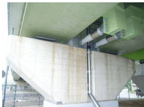
<変位制限装置設置>