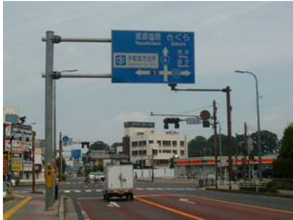
〈国道4号 宇都宮市平松町〉