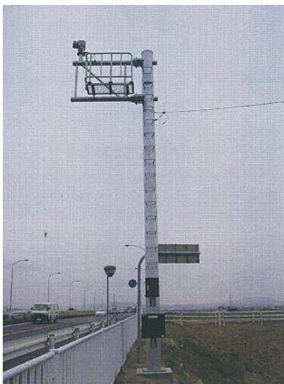
〈国道50号 渡良瀬川大橋CCTV〉