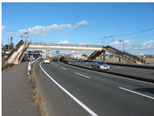
〈国道4号 川岸第2歩道橋〉