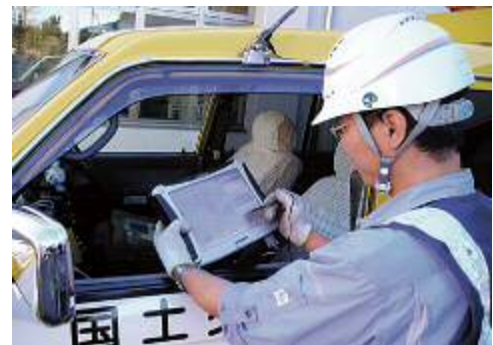
〈パトロール結果の記録〉