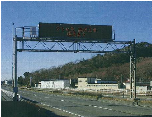
〈国道50号 太田情報板〉