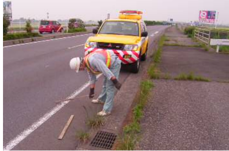
〈通常巡回（落下物処理）〉