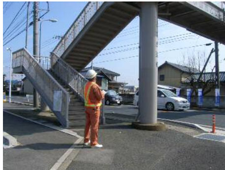
〈定期巡回による道路施設の点検〉