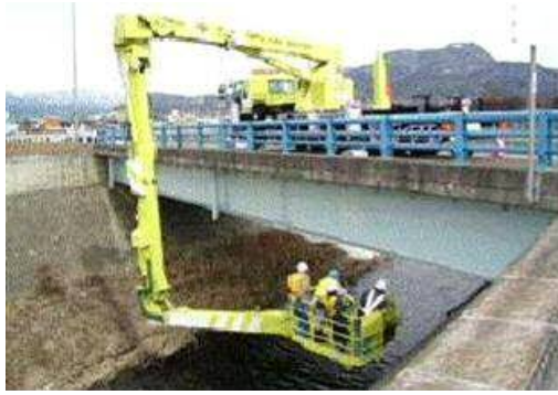
＜橋梁点検車による点検＞