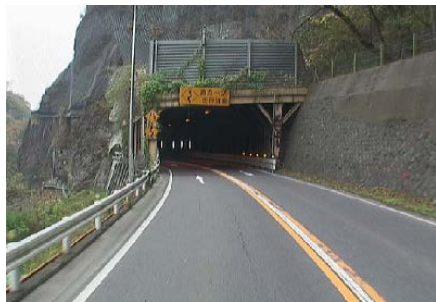
〈ロックシェット〉 (国道17号 渋川市上白井)