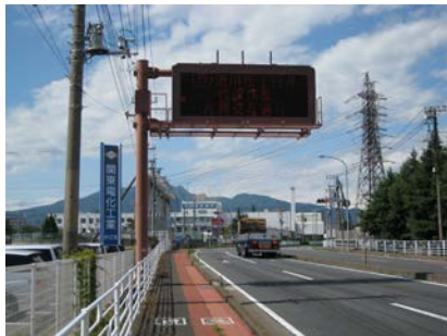
〈大崎情報板〉 (国道17号 渋川市大崎)