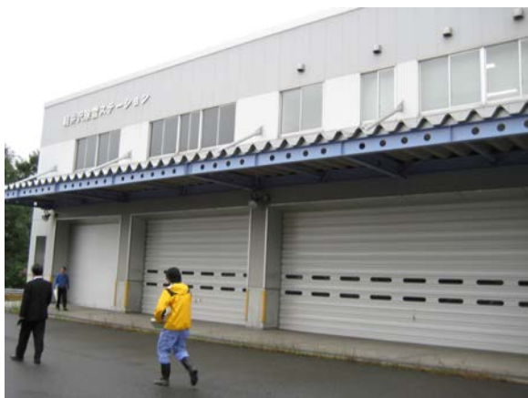
〈除雪ステーション〉 (国道18号 長野県軽井沢町)