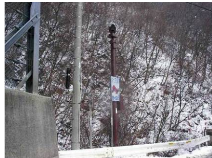
〈新治CCTVカメラ〉 (国道17号 みなかみ町永井)