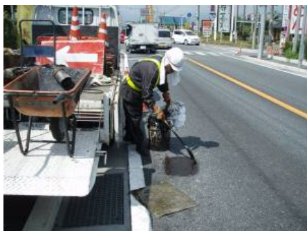
〈路面補修〉（ポットホール）

路面異状（ポットホール、段差など）処理（補修）、落下物回収及び交通事故などの路面油処理などを迅速かつ適切に行います。