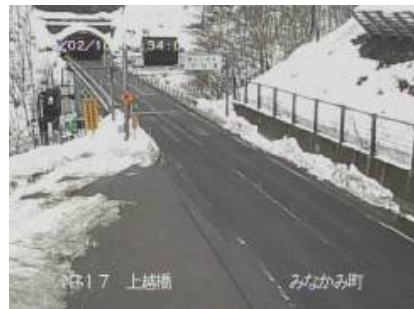
〈上越橋〉 (国道17号 みなかみ町永井)