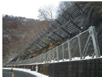
〈雪崩防止柵〉 (国道17号 みなかみ町永井)