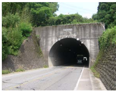
〈霧積トンネル〉 (国道18号 安中市松井田町)