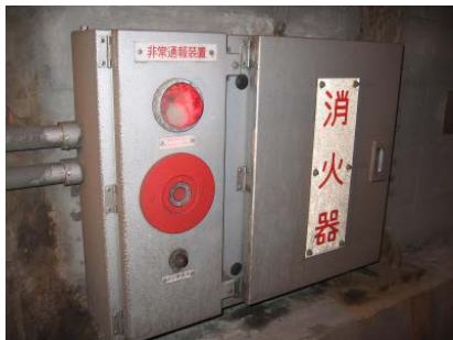
〈三国トンネル非常警報施設〉 (国道17号 みなかみ町永井)