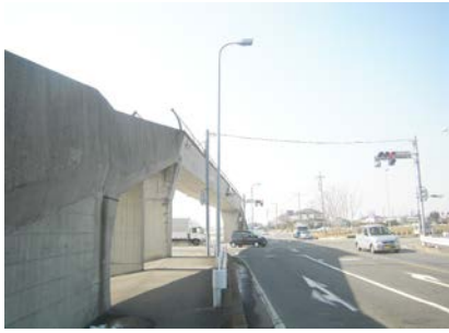
(国道17号上武道路 太田市大館町)