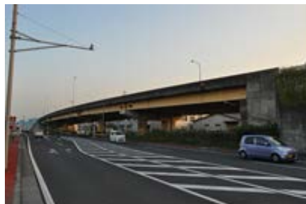
〈広沢高架橋〉 (国道50号 桐生市広沢町)