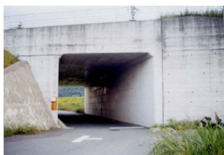
〈板鼻道路ボックス〉 (国道18号 安中市板鼻)