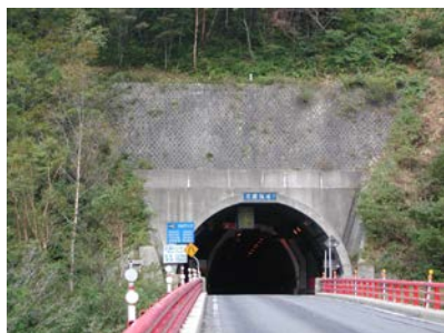
〈三国トンネル〉 (国道17号 みなかみ町永井)