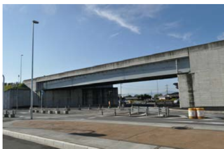
〈今井第一跨道橋〉 (国道17号 前橋市今井町)