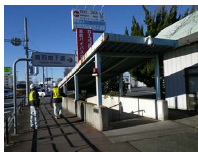
〈鳥羽地下道〉 (国道17号 前橋市鳥羽町)