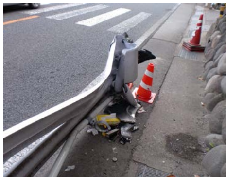
〈道路附属物損傷確認〉