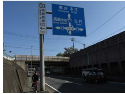
(国道17号 高崎市下和田町)