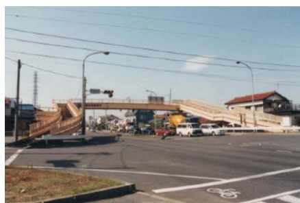
〈倉賀野歩道橋〉 (国道17号 高崎市倉賀野町)