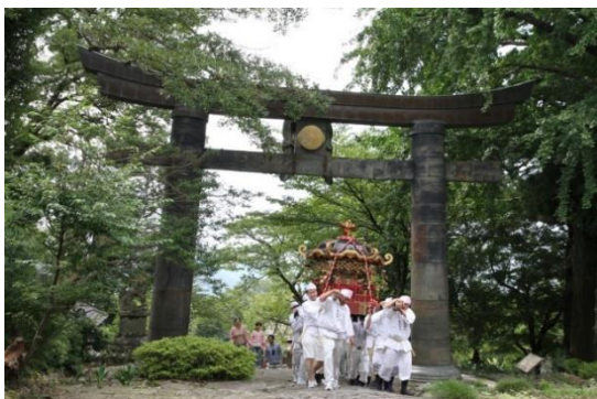
英彦山神宮参道沿いにある重要文化財・ 英彦山神社銅鳥居 2 での神幸祭

第2期計画では、第1期計画で進められなかった周辺景観に配慮した公共施設の修景整備、第1期計画で保存整備が進められた中島家住宅の活用を促す環境整備、文化財指定が進められた英彦山の整備など、第1期計画の事業成果をより高めてまいります。また、民俗芸能等の活動支援や子供たちへの歴史的風致の学習の機会の提供等による町民の郷土愛の醸成、国内外に向けた魅力発信をしてまいります。