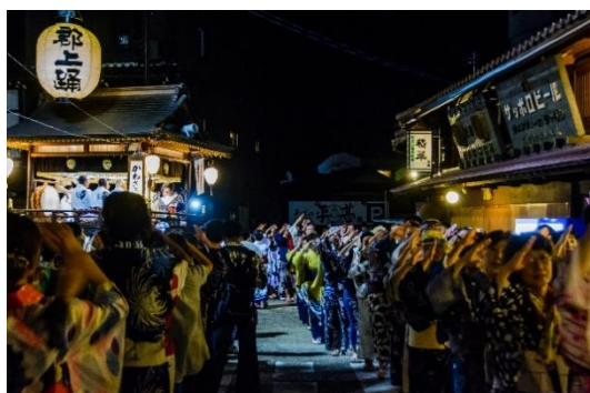
郡上踊(ユネスコ無形文化遺産「風流踊」の1つ)

第2期計画では、引き続き、重点区域内の歴史的建造物や道路の修理修景事業等を通して、歴史的風致の環境整備を行うとともに、今後策定予定の「郡上市文化財保存活用地域計画」や「郡上おどり保存活用計画」などの各種計画の連携を強化して、歴史的風致の維持・向上を図っていきます。また、新たに歴史的風致の区域を増やし、市民の歴史まちづくりへの意識向上を図り、地域の活性化を進めていきます。