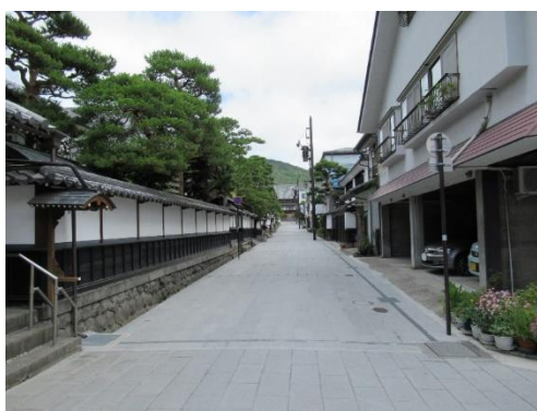
善光寺周辺地域の道路美装化