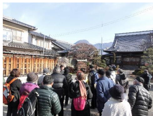
まち歩きイベントの開催