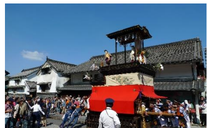
【名古屋市】有松地区の東海道を曳かれる山車