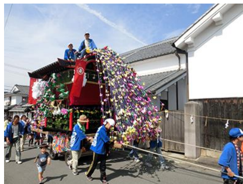
重要文化財・中島家住宅の前を練り 歩く神幸祭