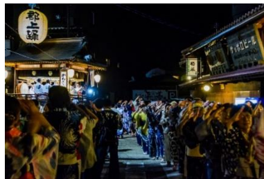
【郡上市】郡上踊 （ユネスコ無形文化遺産「風流踊」の1つ）