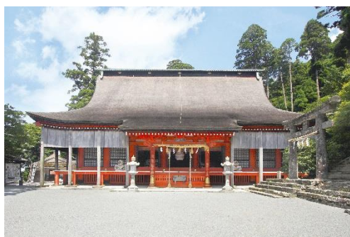
英彦山神社奉幣殿 1 （重要文化財）