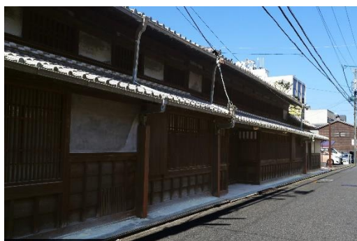
県指定有形文化財 伊藤家住宅

第2期計画では、重点区域に有松地区を加え、引き続き歴史的風致を残す地域を中心に歴史的建造物の保存活用及び歴史的営みの継承を推進し、「名古屋歴史まちづくり戦略」の基本理念である「語りたくなるまち名古屋」の実現を目指します。