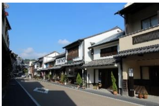
電線類無電柱化を実施した通り