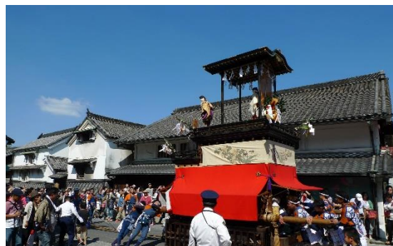
有松地区の東海道を曳かれる山車