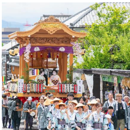
ながの祇園祭 (弥栄神社の御祭礼 屋台巡行)

第2期計画では、第1期計画で芽生えた住民主体の活動を大きく育て、地域固有の歴史や伝統、風情あるまちなみの継承に引き続き取り組むとともに、魅力を伝える効果的な情報発信を行うことで、地域活性化や観光振興にもつなげてまいります。