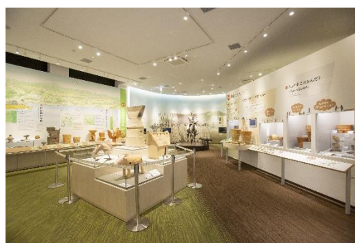
「体感！しだみ古墳群ミュージアム」の展示室