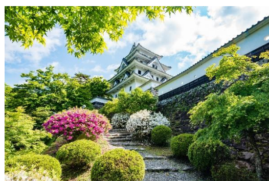
耐震補強工事を終えた郡上八幡城