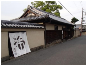
【斑鳩町】井上家住宅 （歴史的風致形成建造物の1つ）