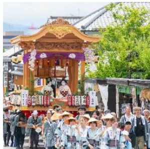
【長野市】ながの祇園祭 （弥栄神社の御祭礼・屋台巡行）

長野市、郡上市、名古屋市、斑鳩町、添田町、竹田市の歴史まちづくり計画（第2期）について、 歴史まちづくり法に基づき、3月18日付けで主務大臣（文部科学大臣、農林水産大臣、国土交通大臣）が認定 します。（各認定都市の詳細は別紙参照）