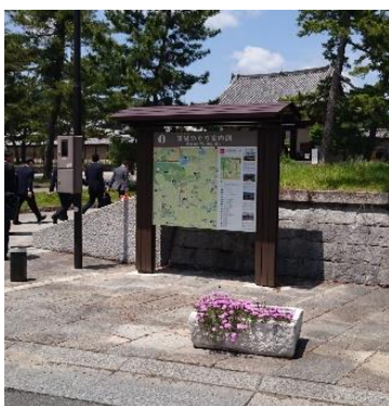
案内板等整備事業