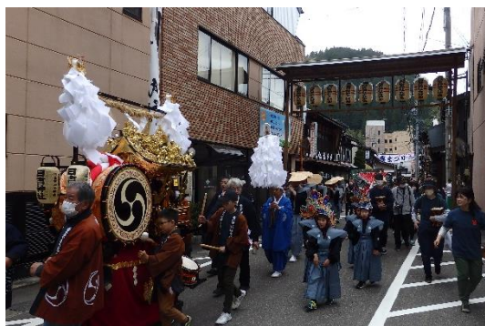
道路美装化路線を練り歩く大神楽