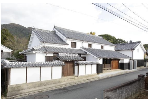
中島家住宅（重要文化財）