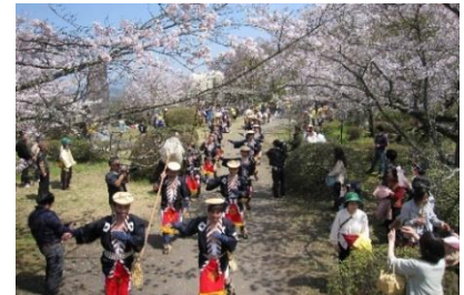
【竹田市】岡城桜まつりで行われる 大名行列