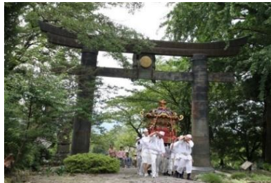
【添田町】英彦山神宮参道沿いにある 重要文化財・英彦山神社 銅鳥居での神幸祭