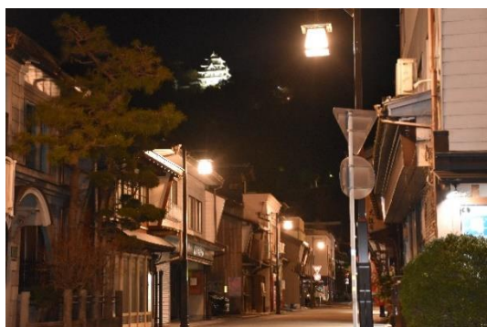
無電柱化実施地区からみる郡上八幡城