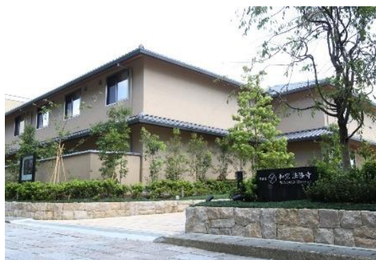
特別用途地区によるホテルの立地