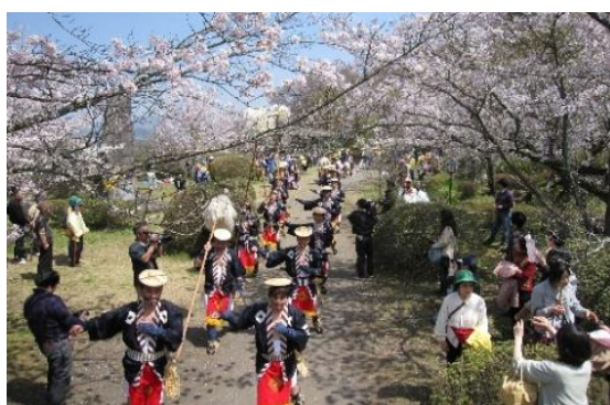
岡城桜まつりで行われる大名行列

第2期計画では、文化財の保存整備を行うとともに、多くの人に文化財を知ってもらえる環境づくりの一環として、文化財と共存する住環境を整備することによる回遊性を向上、デジタルコンテンツを活用した多言語対応等による、さらなる文化財とその周辺の魅力向上を図ることにより、生活者、来訪者の双方が、日常的に行きかう、情感あふれる竹田城下町を歩いて楽しめるまちづくりに取り組みます。