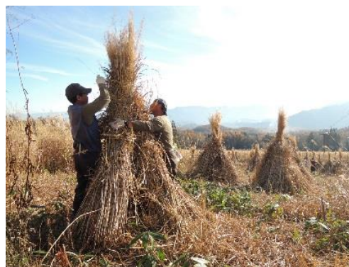
住民主体の活動 (戸隠地区 茅刈りの様子)