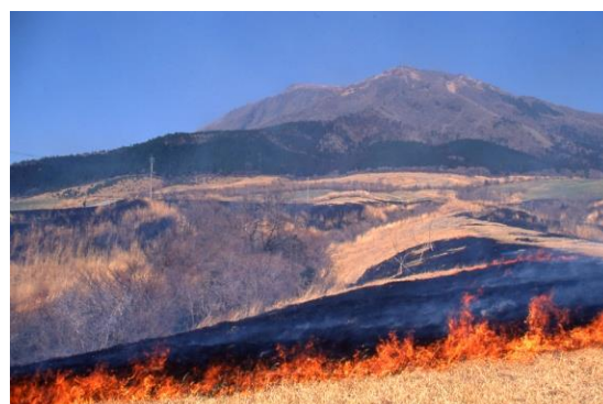
くじゅう 久住高原の野焼き