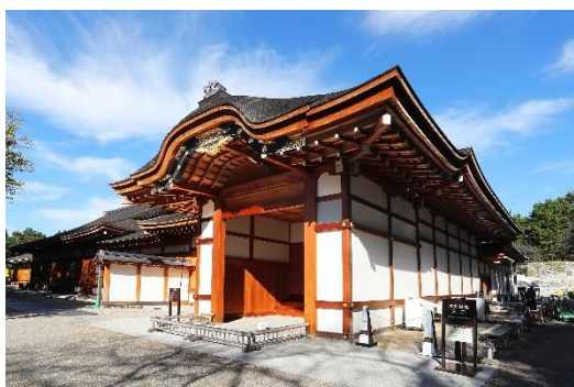
復元された名古屋城本丸御殿