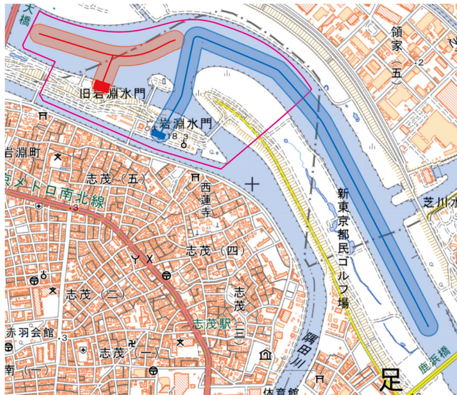
1号機 (Mavic2Pro) 2号機 (Mavic3T) 3号機 (Mavic3)