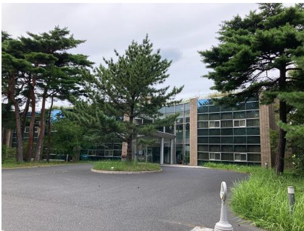
総合管理センター 外観