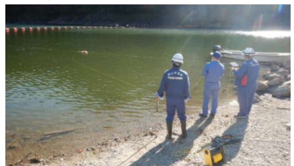
水中ドローン操作訓練