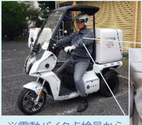
※電動バイク点検員からリアルタイム映像伝送