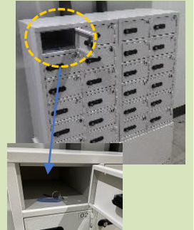
※宅配ロッカーによる鍵の受け渡し