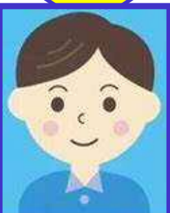
写真データ (JPEG形式等)