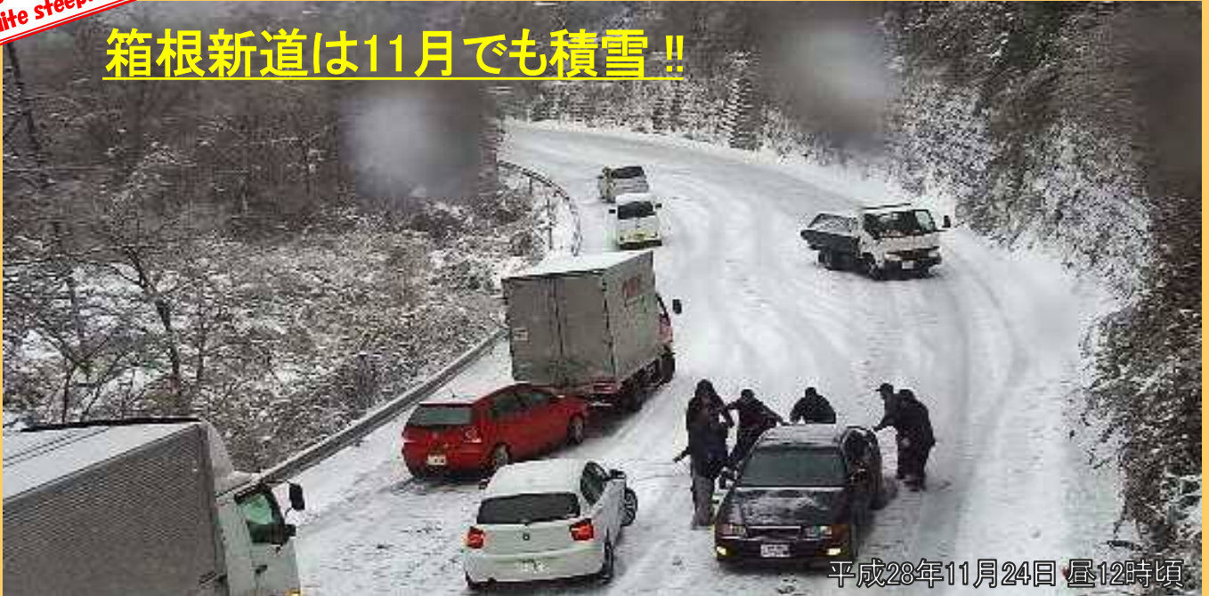
平成28年11月24日 昼12時頃