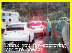
Thank you for approving our tire check.