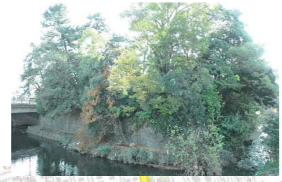
6 篠曲輪跡(推定地) 天正18年(1590年)の小田原城攻防戦で一番戦いの激しかった場所です。