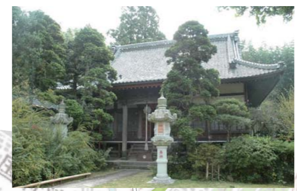
3 眞楽寺 親鸞上人が命名した寺。上人が石に指頭で名字を書かれたといわれる、2メートルほどの帰命石と呼ばれる石があります。