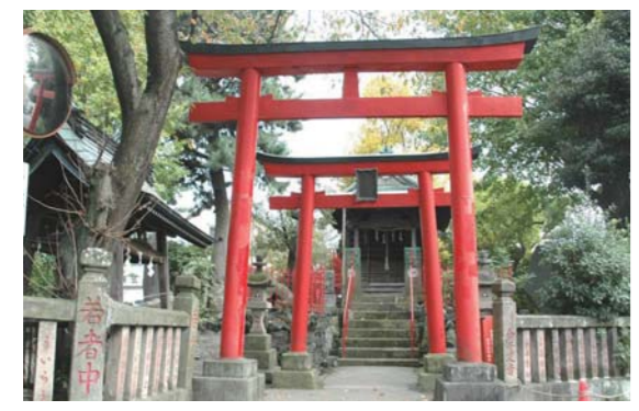
8 北条稲荷と蛙石 北条氏康の死去を老狐の祟りと考えた、その子氏政が社を建てて、その老狐を祀り、守護神として崇めました。また、神社の境内にある蛙に似た蛙石は、天正18年(1590年)の小田原城落城前後、夜泣きしたと伝えられています。