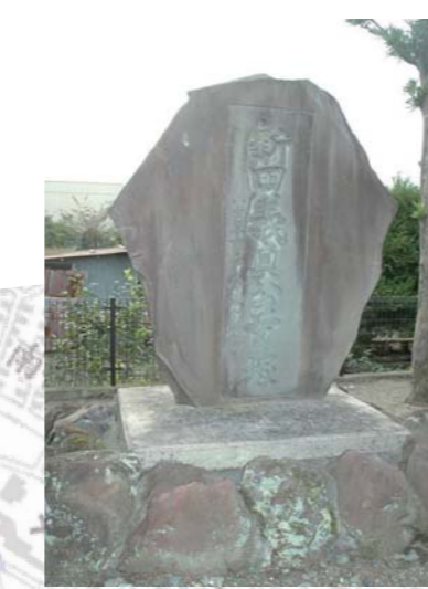
4 新田義貞の首塚 越前藤島で討死した新田義貞の首を、故郷に葬ろうとした家臣宇都宮泰藤がここで病で没した際、義貞の首をいっしょに埋葬したといわれています。