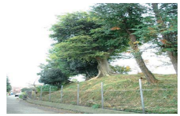
9 小田原城蓮上院土塁 小田原北条氏時代の小田原城の総構遺構。低地に残るものは早川遺構とこの土塁だけで貴重な遺跡です。