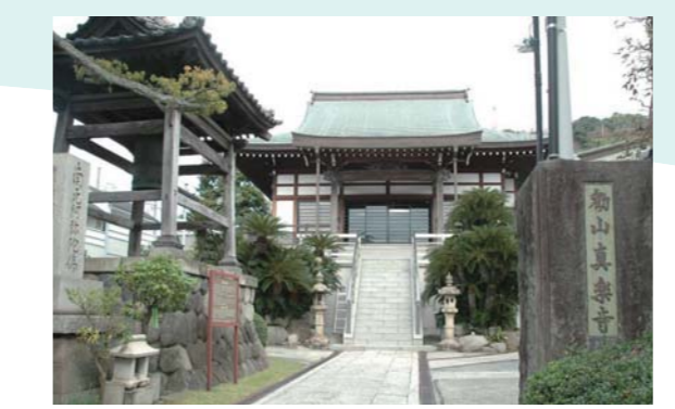
3 眞楽寺 親鸞上人が命名した寺。上人が石に指頭で名字を書かれたといわれる、2メートルほどの帰命石と呼ばれる石があります。

小田原は江戸時代、大久保氏十一万三千石の城下町を兼ねた宿場として、箱根の山越え、関所を控えた宿場として大いに栄えています。そのスケールは東海道屈指で、本陣、脇本陣ともに四軒、そして旅籠屋は九十五軒を数えました。国の史跡に指定されている小田原城はもちろんです。当時の宿場の町並みを今に伝える板橋の旧道、小田原城攻めの時に豊臣秀吉が築いた石垣山一夜城など、貴重な史跡に今でも数多く出会えます。