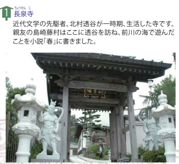
1 長泉寺 近代文学の先駆者、北村透谷が一時期、生活した寺です。親友の島崎藤村はここに透谷を訪ね、前川の海で遊んだことを小説「春」に書きました。