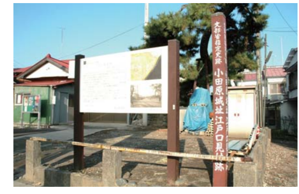
7 江戸口見附と一里塚 大きな松の老木が、小田原宿の東の玄関口、江戸口見附跡です。