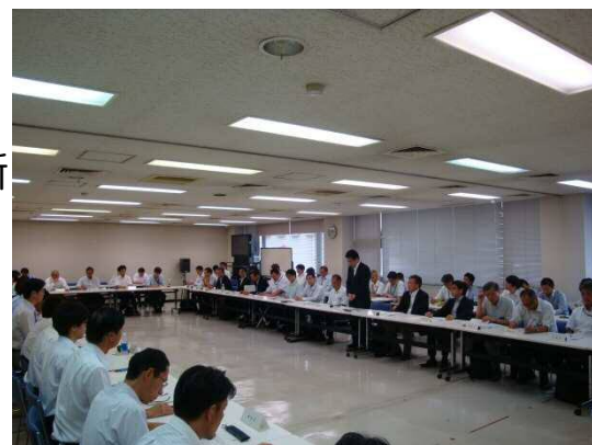
神奈川県道路メンテナンス会議の実施状況3