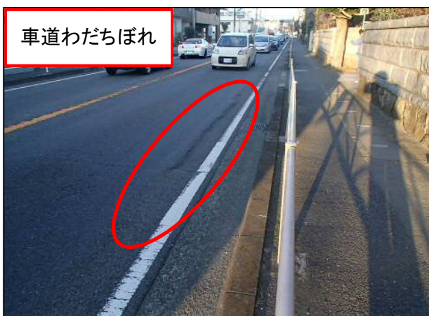
徒歩パト点検状況