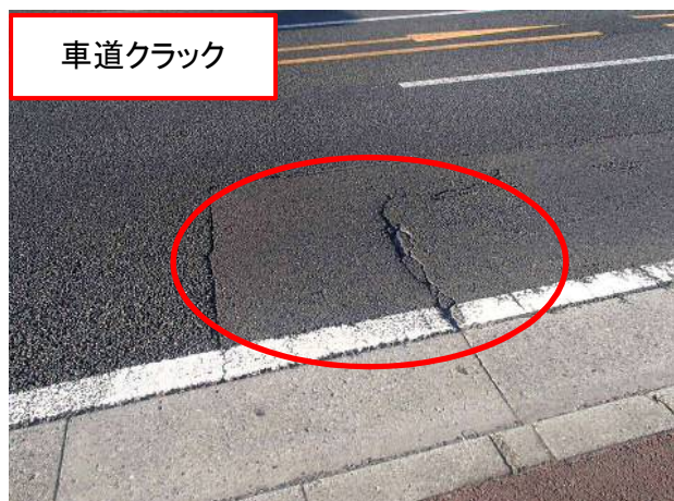
徒歩パト点検状況