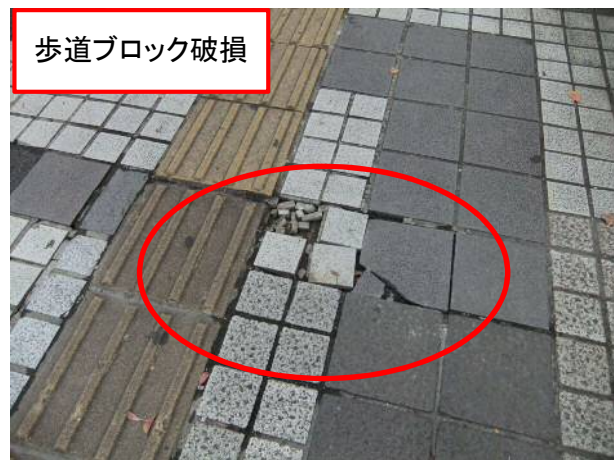
徒歩パト点検状況