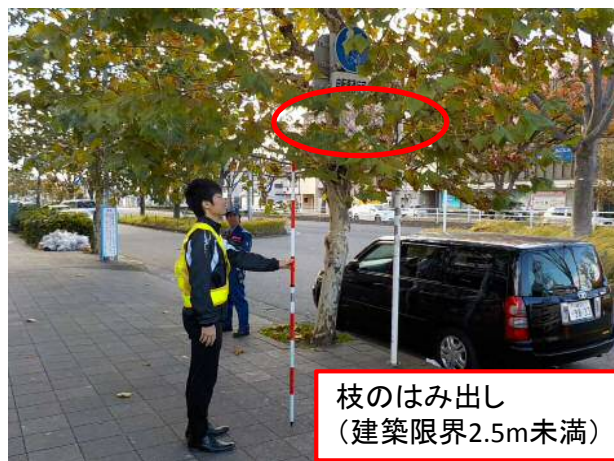
徒歩パト点検状況