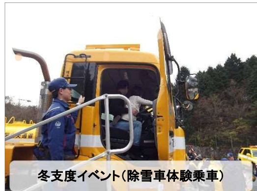
冬支度イベント(除雪車体験乗車)

※取材を希望される方は、事前に下記問い合わせ先までご連絡ください。 なお、除雪作業を行うような悪天候時など、開催を中止する場合があります。