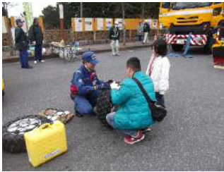
← チェーン装着実演 (H29年度)

また、冬期のドライブにおいて必要となるタイヤチェーンについて、装着に不慣れな方などを対象に装着実演を行い、携行の必要性と、降雪時の早めの装着を呼びかけます。