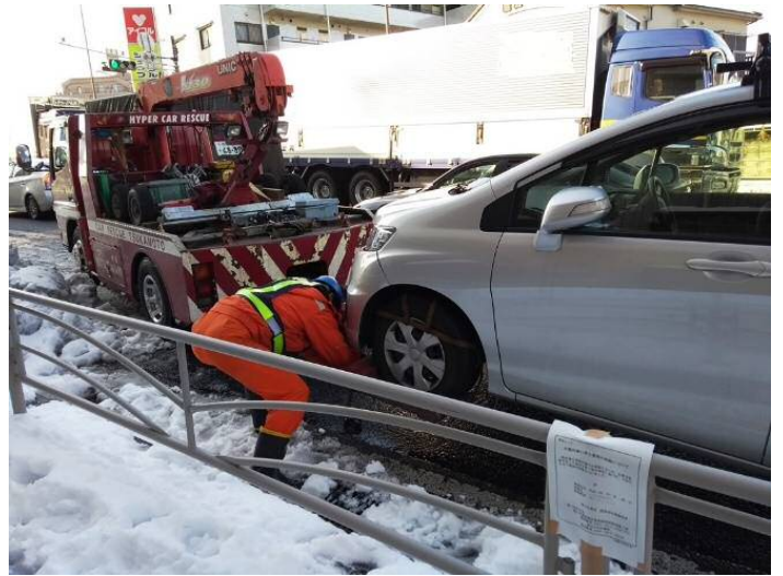
国道246号災害対策基本法による 乗り捨て車両のレッカー移動