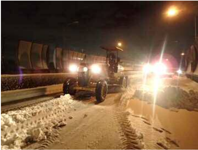
重機による車道除雪の状況

今年の1月22日から23日にかけて関東地方にもたらした大雪や2月1日から2日にかけての降雪による横浜国道事務所管内における除雪、路面凍結解消に昼夜を問わずご尽力いただいた皆様に対し、雪害対応功労者として感謝状の贈呈を行います。