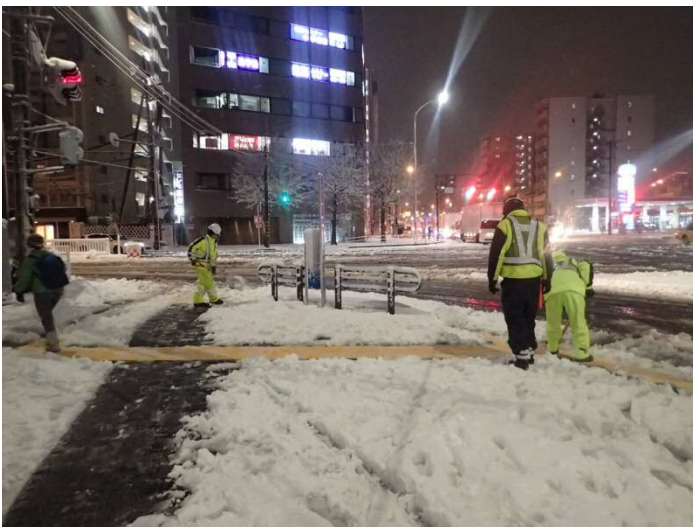
国道1号浜松町交差点歩道部 人力による歩行者通路の確保状況 その1