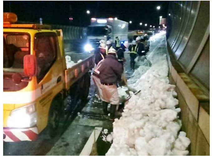
人力による路肩除雪の状況