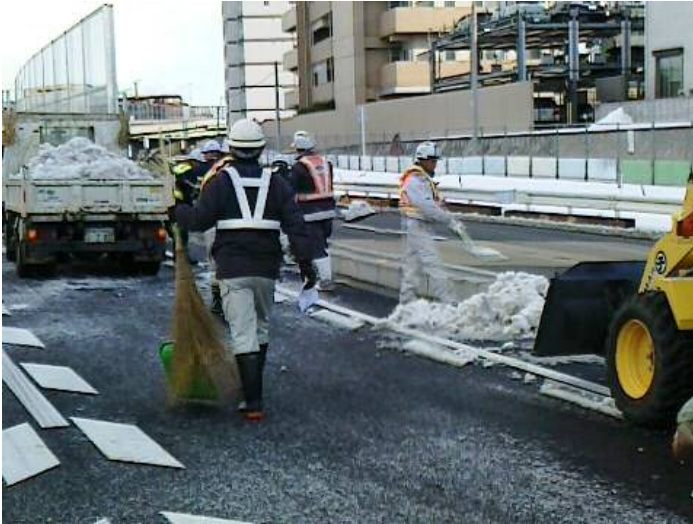
国道16号横浜町田立体 人力による排雪作業の状況 その1