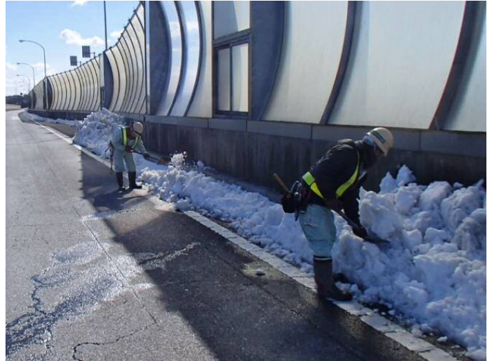
国道16号横浜町田立体 人力による排雪作業の状況 その2