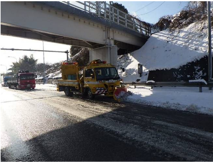
国道16号保土ヶ谷バイパス 重機による車道除雪の状況