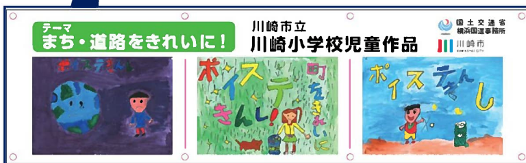
▲ 啓発絵画横断幕のイメージ(※今回掲示)