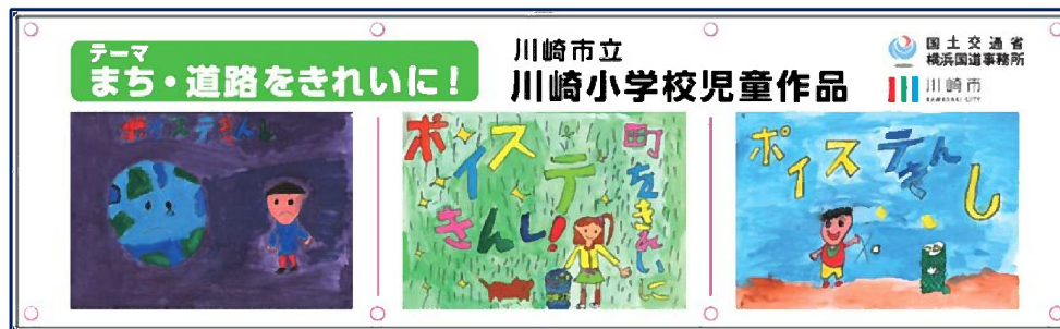
▲ 掲示する啓発絵画横断幕のイメージ(使用絵画:川崎市立川崎小学校提供)