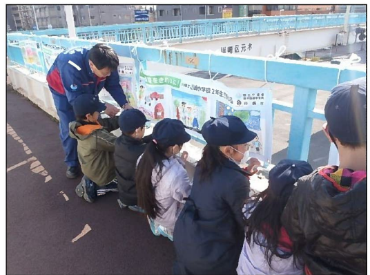
▲ 横断幕の掲示イメージ