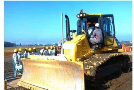
「建設機械の実演」のイメージ