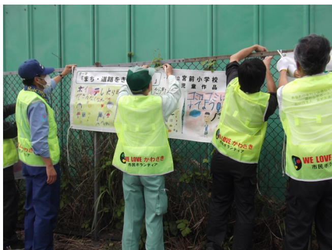
3. 啓発横断幕の設置状況