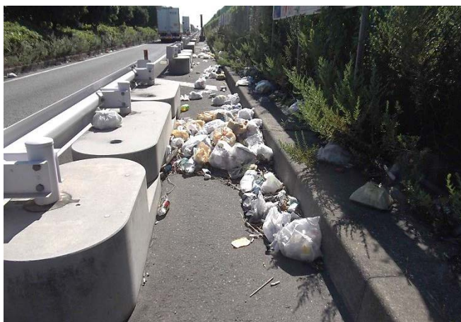
2. ポイ捨てごみの現状