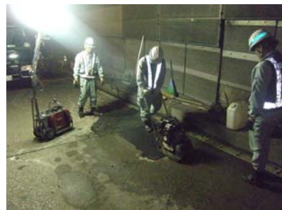
▲路面補修の状況(昨年度)