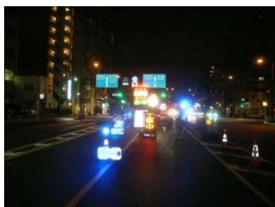
▲通行規制の状況(昨年度)

(4) 主な工事内容：照明点検、路面補修、排水施設点検、トンネル非常用通報設備点検、 消火栓・防災ポンプ点検等