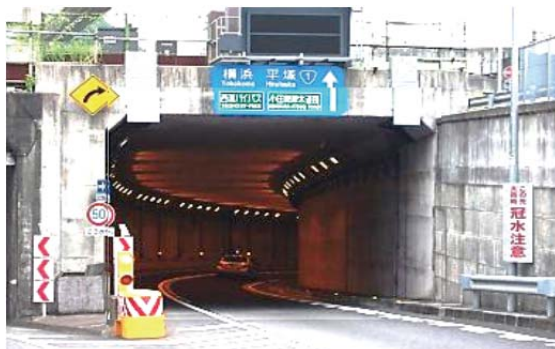
▲アンダーパス部の例【NO.112 箱根町山崎地先】