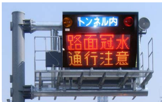
▲冠水対策の例【電光掲示板による情報提供】

マップに関する詳しい情報は、下記の横浜国道事務所のホームページでもご覧頂けます。