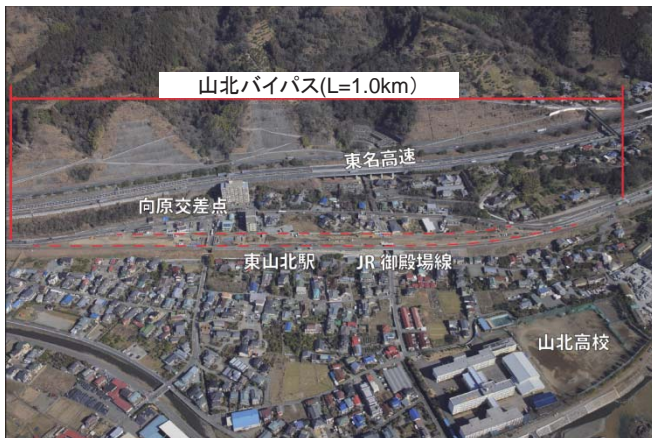
現在の状況(平成24年1月撮影)