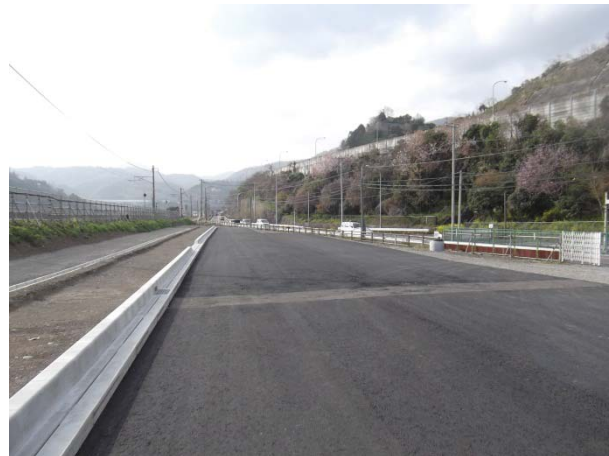
現道246号取付け部の状況(平成24年4月撮影)