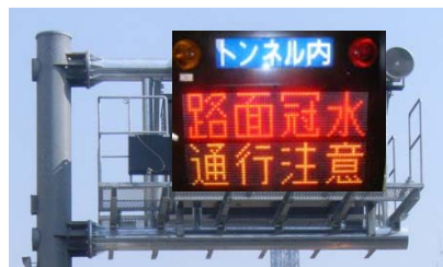
▲冠水対策の例【電光掲示板による情報提供】