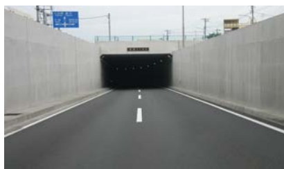
▲アンダーパス構造の例【NO.111 戸塚区原宿】

今後とも、横浜国道事務所では、道路管理者としてパトロールの強化をはじめ、冠水対策に取り組んで参ります。