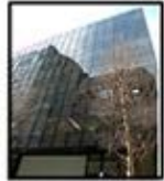
TKP 横浜駅西口 ビジネスセンター (谷川ビルディング ANNEX 地下2階 入口は正面左側になります)

TEL: 045-412-4362 ホームページ: http://tkpyokohama.net/access/