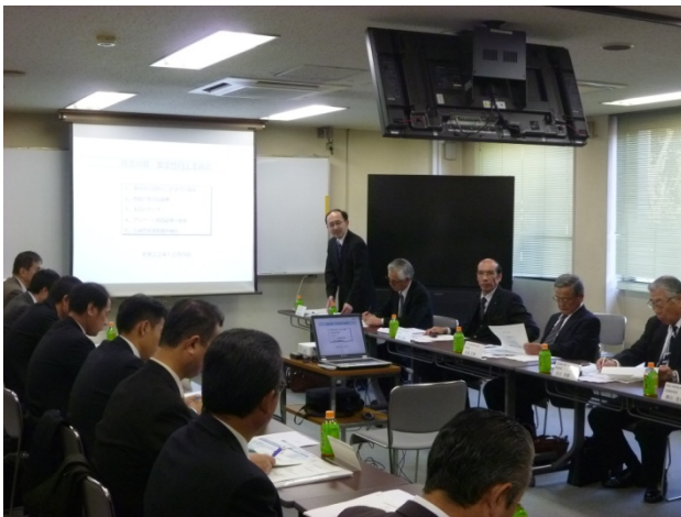
委員長のあいさつ