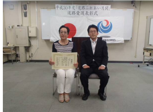
小田原市第二十九区自治会 様 2/2