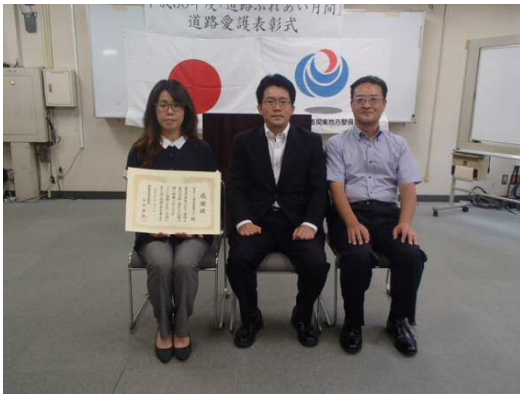
(株) ミツバ 横浜研究開発センター 様