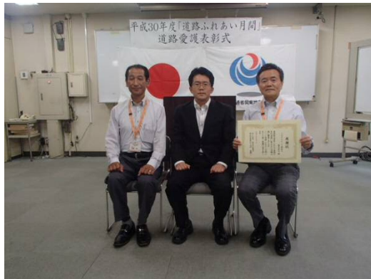
トヨタカローラ神奈川 (株) 様