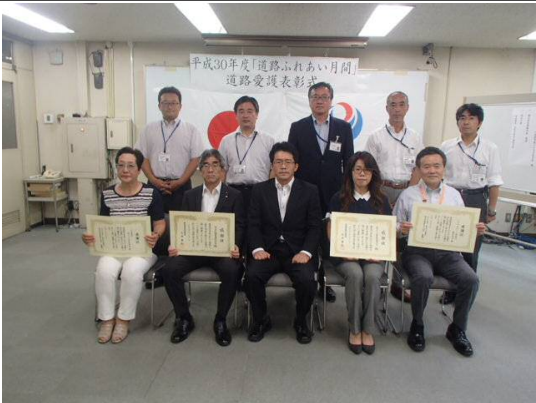
道路愛護の功績により表彰された皆様