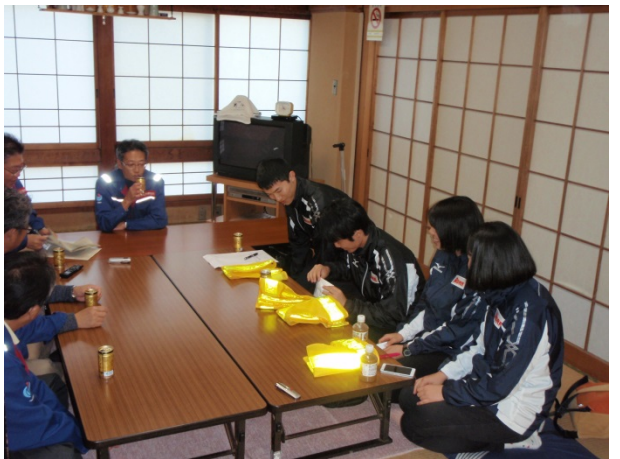
意見交換会(小田原出張所)