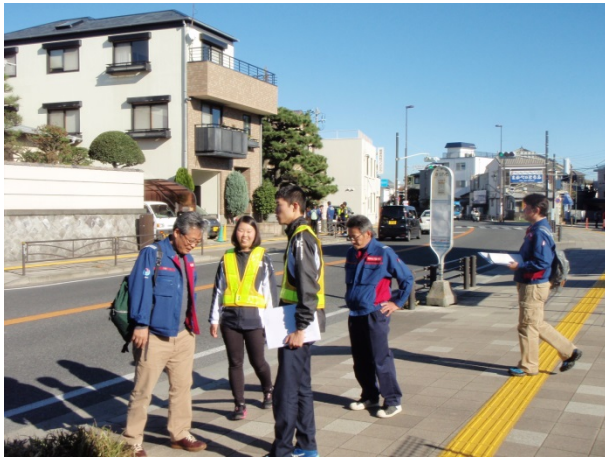
徒歩パトロール(下り線)