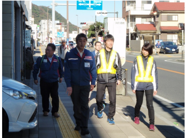
徒歩パトロール(上り線)