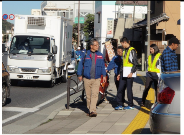
徒歩パトロール(下り線)