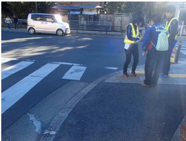
徒歩パトロール(異状発見状況)