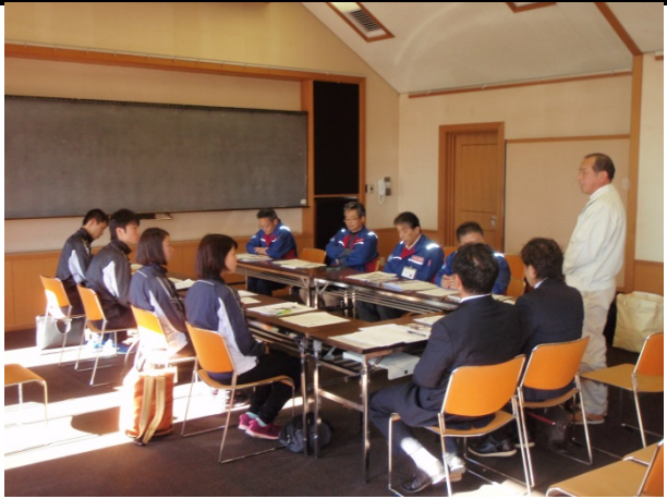
徒歩パト事前説明(大磯図書館)