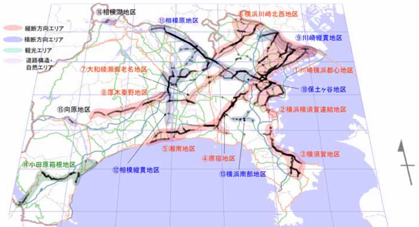
図 移動性が阻害されていると考えられる 16 のエリア