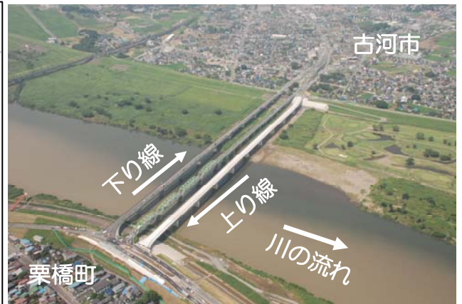
利根川橋(埼玉県側より茨城県側を臨む)平成20年度撮影