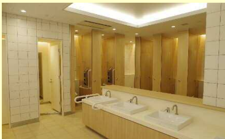
<トイレ個室(右奥)・着替え室(左奥)>