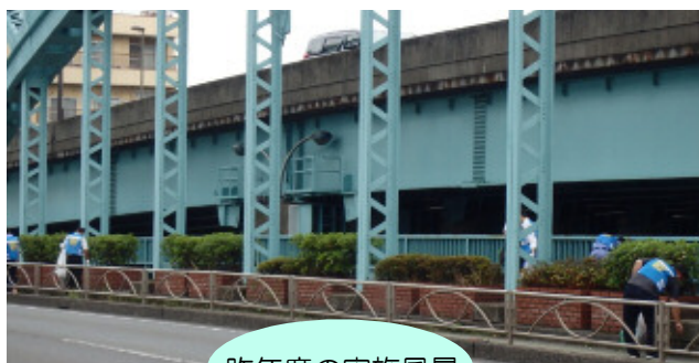
昨年度の実施風景