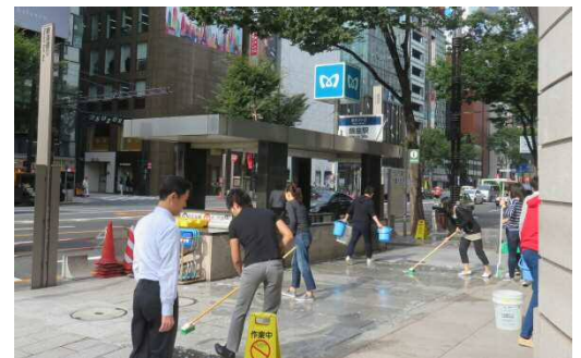
平成28年10月14日(秋)の 清掃風景

銀座通連合会：銀座通り、晴海通りを中心とした 約230店舗で組織する地域企業連合